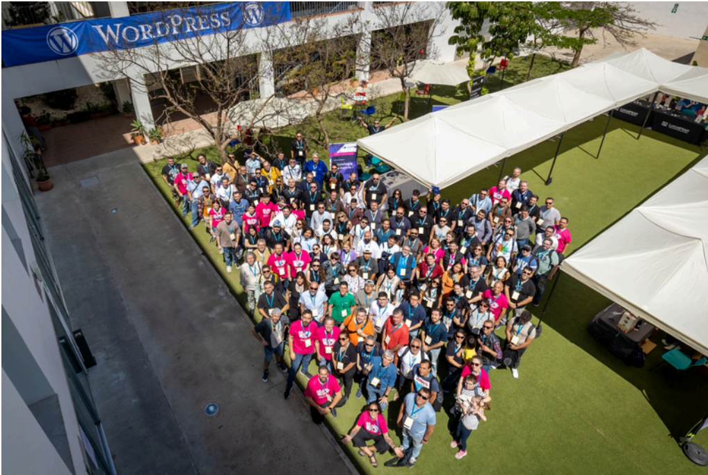
WordCamp Málaga 2025